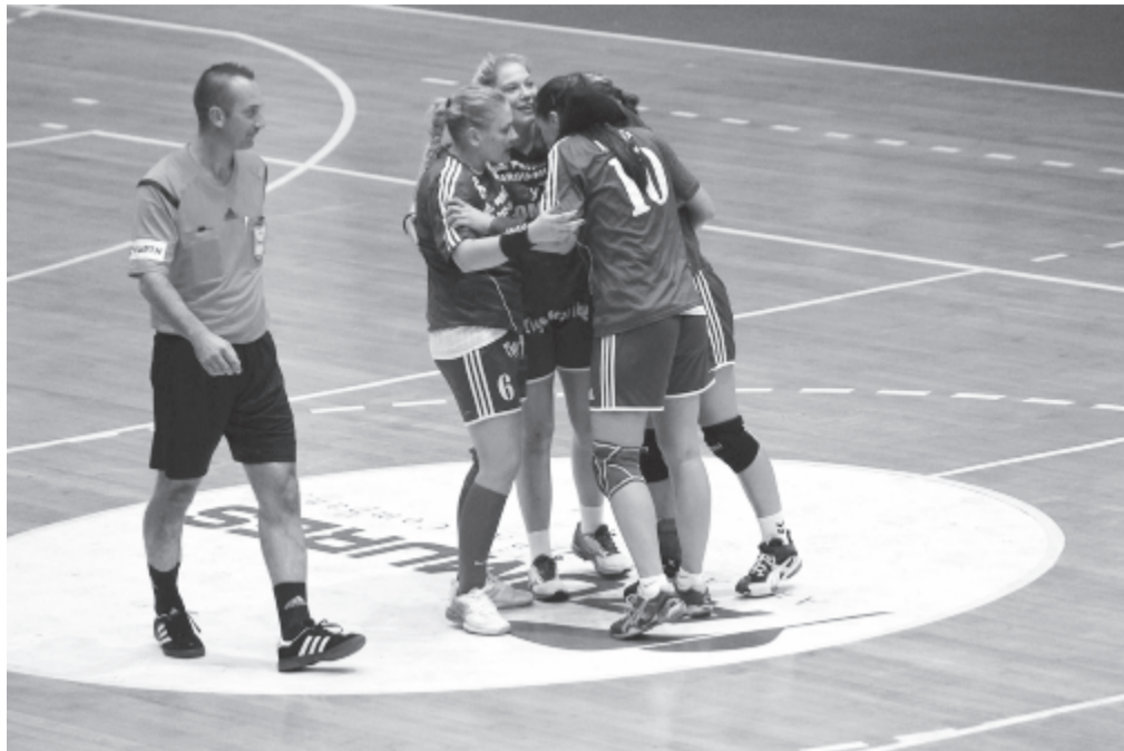
Egy elvesztett mérkőzés, majd az aradiak visszalépésének híre után újra volt miért örülni, idegenben nyert a marosvásárhelyi együttes.

Kezdődött minden azzal, hogy a Mureşul vereséget szenvedett az A osztályos bajnokság 3. fordulójában hazai pályán rendezett találkozón, a Resicabányai Universitatea együttesétől. Bár a bánsági együttes eddig háromból három mérkőzést nyert, egyáltalán nem tűnt félelmetes szintet képviselő csapatnak. Csak kicsit kellett volna összeszedniük magukat a Mureşul játékosainak, hogy megszerezzék a három pontot, de pontosan azok hagyták cserben a csapatot, akik a legtapasztaltabbak, akiktől a legtöbbet lehetett volna elvárni: Moloci és De Oliviera mélyen képességeik alatt teljesítettek, körbehajigálták a kaput (vagy az ellenfél kapusát találták telibe), ezzel rengeteg lehetőséget elpuskáltak a felzárkózásra. Feltűnő volt továbbá a kapusok közötti különbség, elsősorban