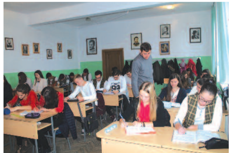
A XI. D osztály

Kérdésünkre, hogy volna-e igény a magyar tannyelvű szakképzésre, hiszen szakmunkások iránt egyre nagyobb a kereslet a munkaerőpiacon, az aligazgató elmondta, hogy volna, de nincs megfelelő képzettségű szaktanár a városban, így az autószerelői, könnyűipari, elektro, mechatronika, mechanika és fémmegmunkáló profilon csak román nyelven folyik az oktatás. A diákok gyakorlati képzését szerződéses alapon cégeknél oldják meg, de ez csak a gyakorlatra szól, és nem garancia arra, hogy a cég majd fel is veszi a végzősöket.