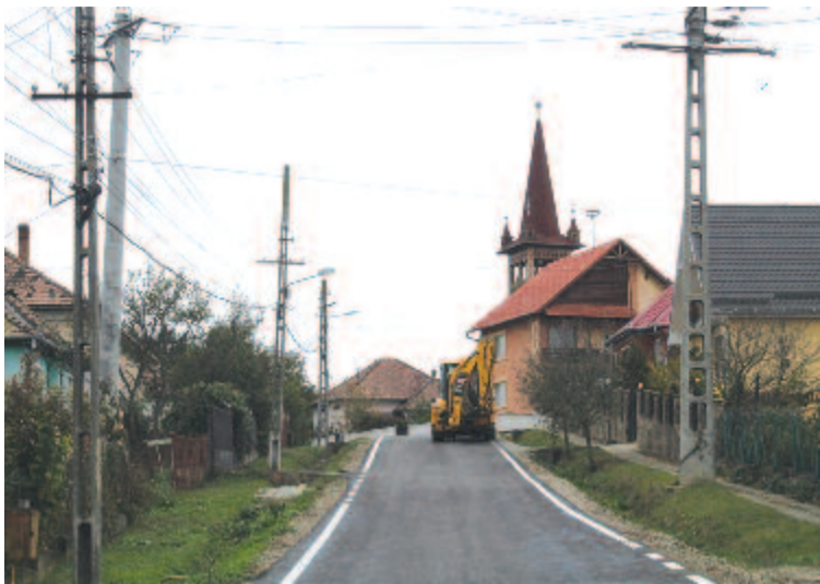
Aszfaltos utcák Andrásstelepen