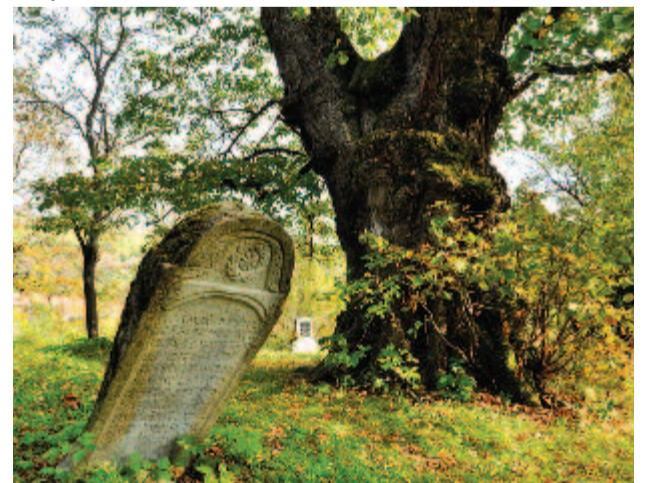
Az 500 éves cserefa

Megígértük: visszatérünk, mert tanulságos terepszemle volt.